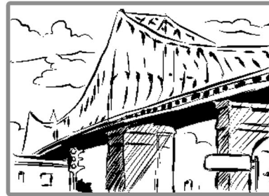
Jacques Cartier (1491-1557)