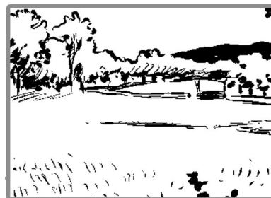
Jeanne Mance (1606-1673)